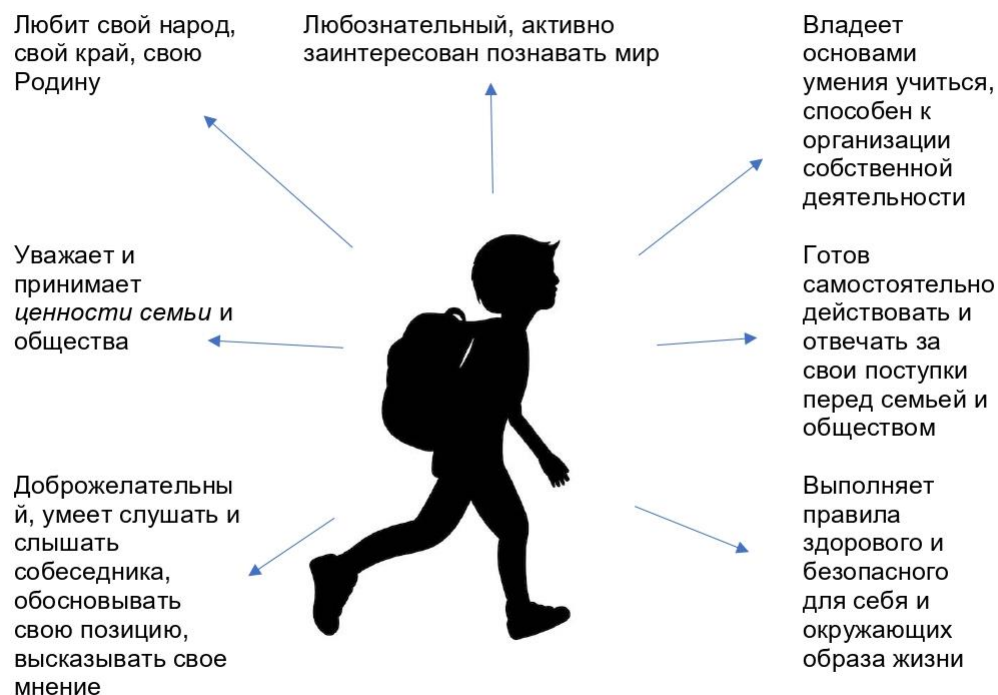
Рисунок 2 – «Портрет» выпускника начальной школы на основе требований ФГОС НОО

В рамках формирования у ребенка духовных ценностей в соответствии с требованиями ФГОС НОО в образовательных учреждениях, помимо основных академических часов, проводится ряд внеурочных и внеклассных мероприятий, а именно: